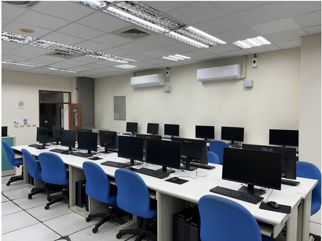
圖二、由計畫經費購入電腦教室的個人電腦